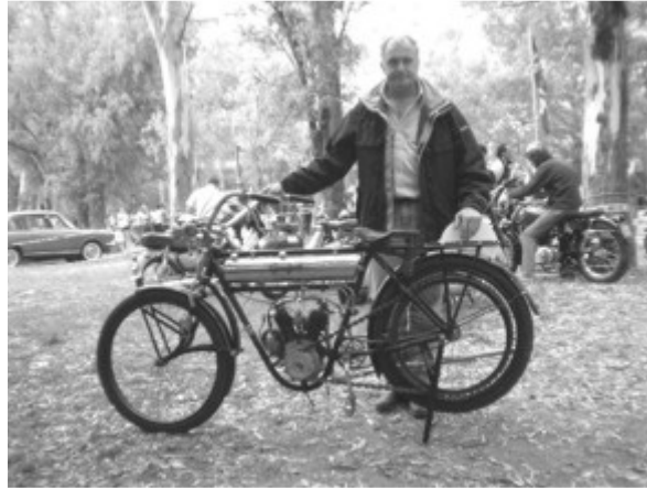
Motocicleta Peugeot 1913