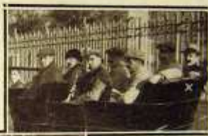
Individuos de la Cruz Roja, que atenderán a los corredores.

La primera carrera de motocicletas organizada en Bilbao, que se celebró el pasado domingo resultó una fiesta interesante y por todo extremo agradable. Para presenciar la salida y el regreso de los corredores, acudió al campo de Volantín un público muy