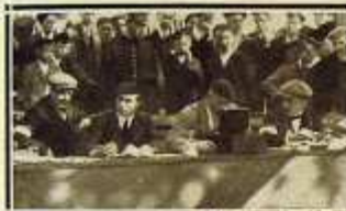
El jurado calificando la carrera.

La primera carrera de motocicletas organizada en Bilbao, que se celebró el pasado domingo resultó una fiesta interesante y por todo extremo agradable. Para presenciar la salida y el regreso de los corredores, acudió al campo de Volantín un público muy