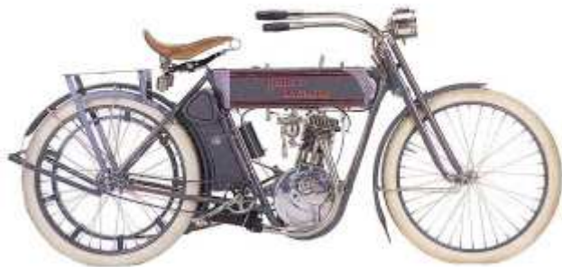
Harley-Davidson Model 7 1911

La meta está bien guardada, con el objeto de evitar desgracias, ha prometido el señor gobernador y el alcalde don Federico de Moyua un buen número de guardias, para tener en condiciones la pista y que puedan desarrollar los motociclistas sus mayores velocidades.