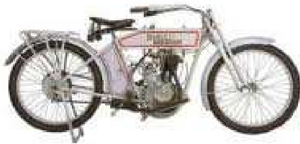
Motor Sarrion Model 128 - 1911

Por fin llega el día histórico el 5 de Noviembre de 1911, la primera carrera en Bizkaia y como tal prueba oficial la primera de España.